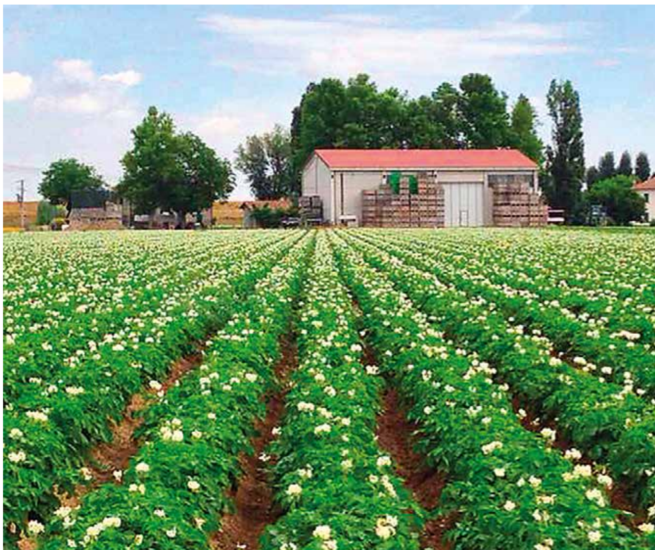
Campo di patate in fiore